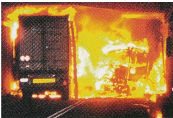
1. ábra: Tűz a Szent Gotthard alagútban (2001. 10. 24.)

A világ alagútjaiban, a szigorodó biztonsági előírások ellenére, a forgalom növekedésével egyre gyakrabban következik be baleset. Az ezekkel együtt járó tüzesetek során jelentős mennyiségű hő szabadul fel (1. ábra). A keletkező hőmennyiség a műtárgy szerkezeti kialakítása és elhelyezkedése miatt csak nagyon lassan képes eloszlni, így a szerkezetben, a tűz környezetében jelentős léghőmérsékleti értékek alakulnak ki.