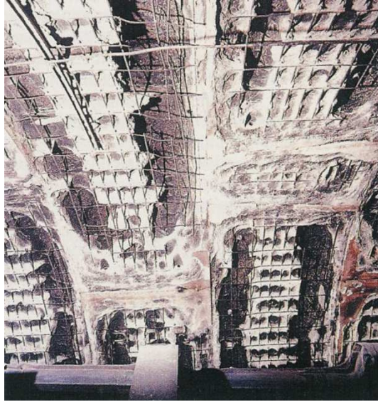
2. ábra: Betonfelület és felszínre került vasalás a Csatorna Alagútban kitört tűz után